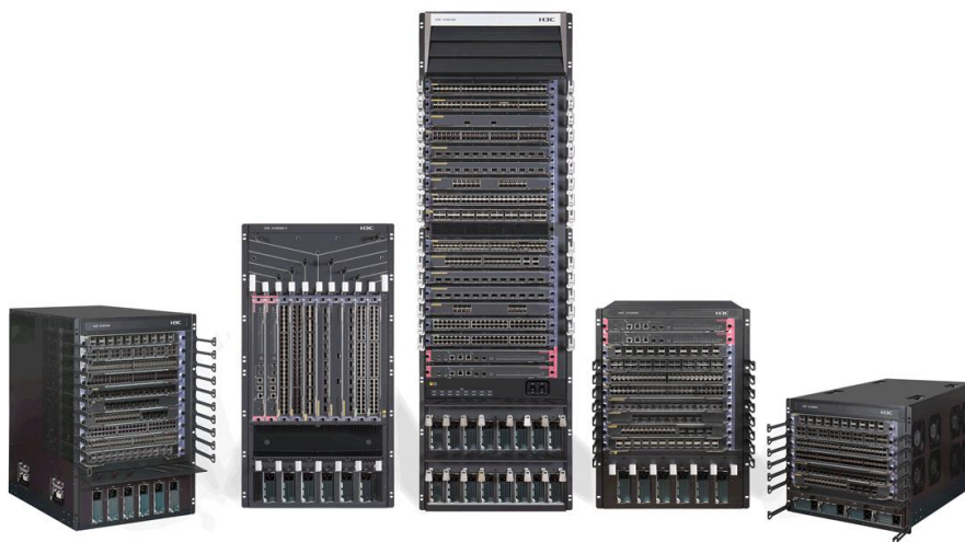
S10500X 系列以太网核心交换机

S10500X 产品包括 S10506X、S10508X、S10508X-V、S10510X 和 S10516X 五个型号，能够适应不同网络规模的端口密度和性能要求，为用户的核心网络建设提供有力的设备保障。